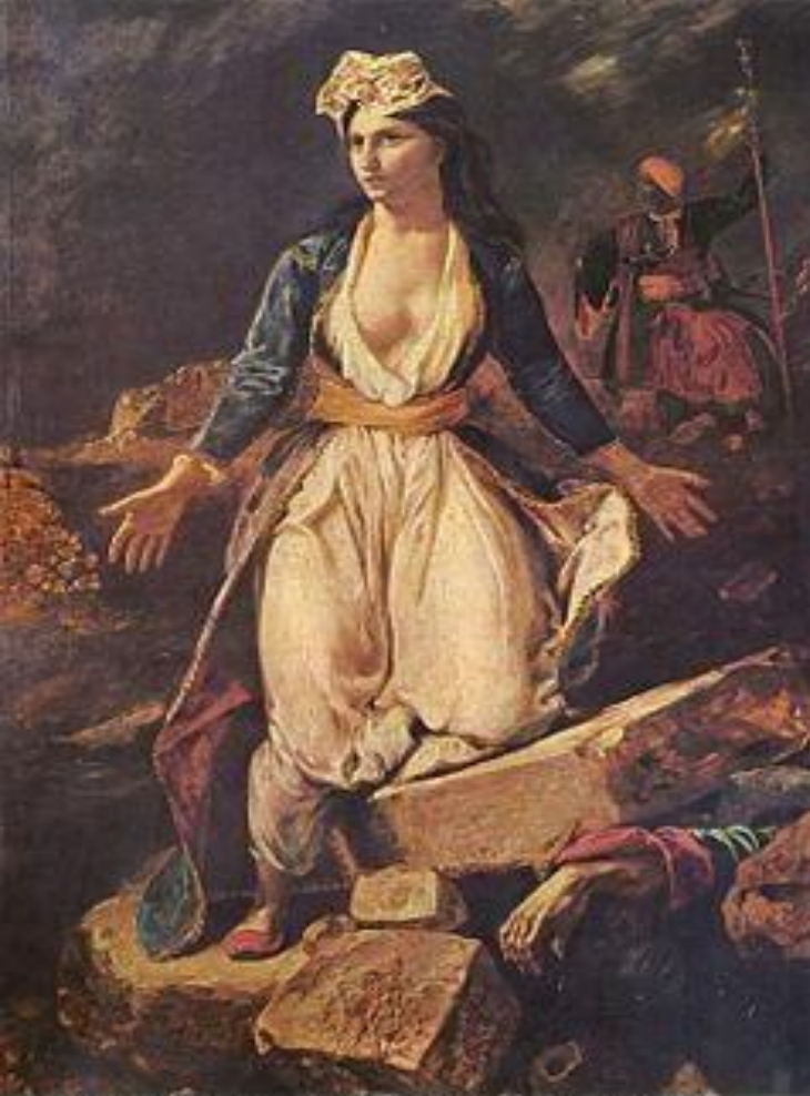
Η Ελλάδα στα ερείπια του Μεσολογγίου La Grèce sur les ruines de Missolonghi